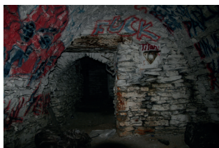
sklepení ze 16.-17. století