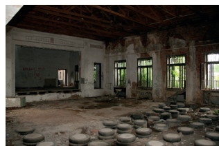
sál v roce 2014

Srdečně Vás všechny zdraví a přeje šťastné a veselé Vánoce Jaroslav Zelený