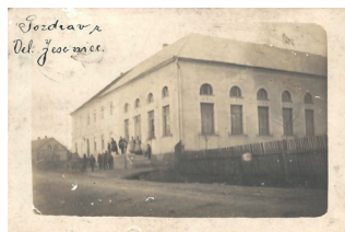
hostinec „Na Sále“ v roce 1912-1916

Tento hostinec si uchováme ve svých vzpomínkách jako na hospodu „Na Sále“, „U Tří děvčátek“ či „Auli hotel“.